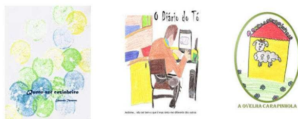
Publicações digitais e impressas, com cerimónias de apresentação pública, nas instalações da biblioteca escolar

O ano letivo de 2010/2011 registou um assinalável aumento do número de publicações: Conselhos para uma Alimentação Saudável , PHDA - Perturbação da Hiperactividade com Défice de Atenção , Bullying - um workshop de ALTA QUALIDADE , Dia Internacional da Tolerância , A Maria Castanha foi a Vila Fernando , Moedas da União Europeia ANTES do Euro , A Moeda Única - O EURO , Grandes Matemáticos , Obras de Escher , Os Ovos Misteriosos foram a Barbacena , A Ovelha Carapinhola , O Diário do Tó , 25 de Abril: Breve Crónica da Revolução e Jogos da Liberdade , Quero ser cozinheiro .