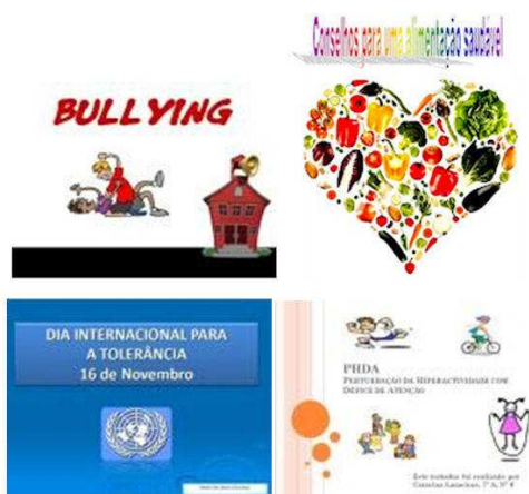
Publicações digitais decorrentes de projetos de turma, planos de desenvolvimento e projetos de departamento/ grupo de docentes