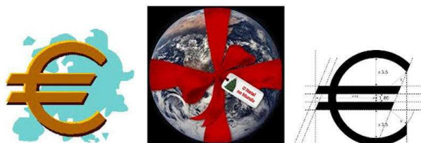
Publicações digitais com exposições em simultâneo