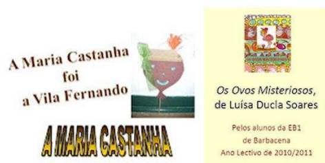
Publicações digitais decorrentes de atividades e projetos de leitura

Todos estes projetos envolveram turmas e alunos desde o 1º CEB até aos cursos EFA, conjugaram esforços de docentes de variadas áreas disciplinares, desde a